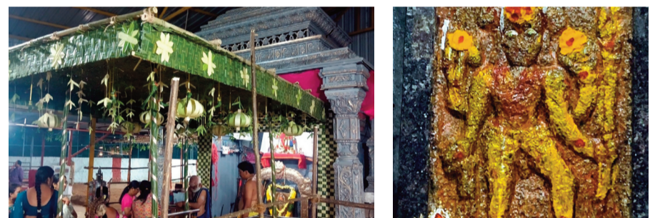
ఉప్పల్, డిసెంబర్ 21 (కౌత్స్వరం):