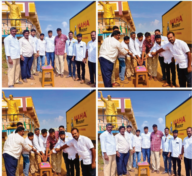
పాములపాడు, డిసెంబర్ 21 (కౌత్తస్వరం):