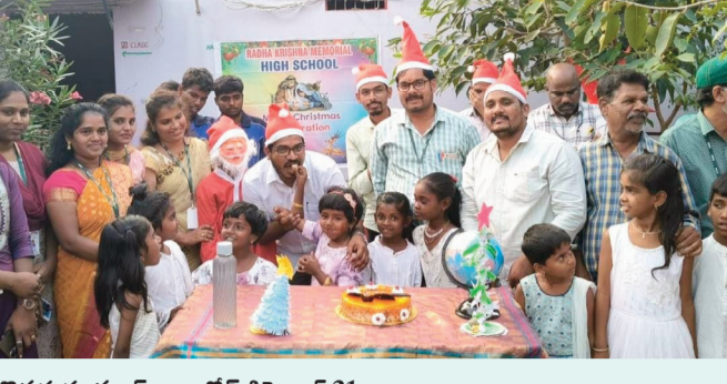
కొత్తస్వరం స్కూల్ రామకొడె డిసెంబర్ 21

సంగారెడ్డి జిల్లా రామకొడె మండల కేంద్రంలో రాధాకృష్ణ మెమోరియల్ హైస్కూల్లో శనివారం నాడు అంగరంగ వైభవంగా సెమీ క్రిస్మస్ వేడుక లను నిర్వహించారు. అనంతరం కరెస్పాండెంట్ పాండు సార్ మాట్లాడుతూ క్రిస్మ పుట్టాకే క్రిస్మ శకం అని క్రిస్మ పుట్టకముందు క్రిస్మ పూర్వం అని పిల్లలకు చాలా చక్కగా వివరించారు. అలాగే క్రిస్మ పులు సెమీ క్రిస్మస్ ఎందుకు జరుపుకుంటారు. అని ఈ విషయాలను కూడా పిల్లలకు చాలా చక్కగా వివరించడం జరిగింది. క్రిస్మస్ తాత డ్రెస్ వేసి కాసేపు అలరించారు. అనంతరం క్రిస్మస్ కేక్ కట్ చేసి ఒకరికొకరు తిని పించుకున్నారు. ఈ కార్యక్రమంలో ఉపాధ్యాయులు, ఉపాధ్యాయులు, పిల్లలు కరెస్పాండెంట్ పాండు సార్ తదితరులు పాల్గొన్నారు.