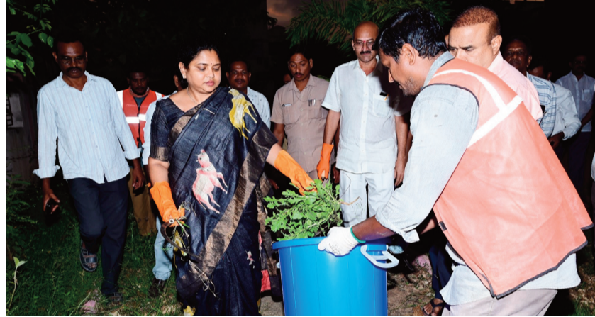
జిల్లా కలెక్టర్ చదలవాడ నాగరాజ్