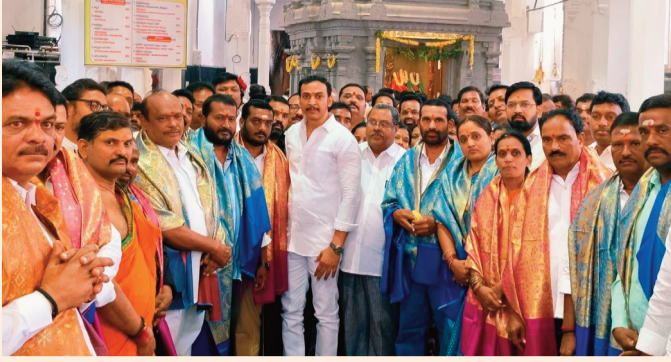
ఉప్పల్, డిసెంబర్ 21 (కౌత్స్వరం):