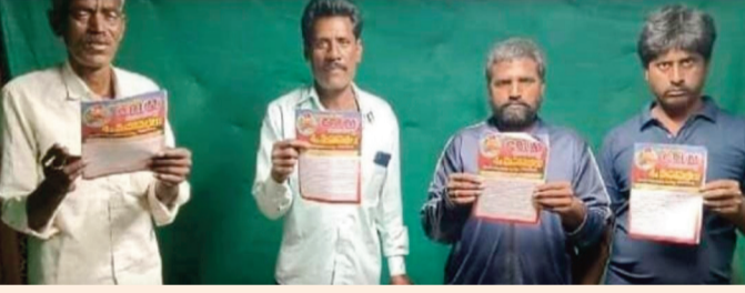
కౌత్స్వరం న్యూస్ రాయికోడ్ డిసెంబర్ 21