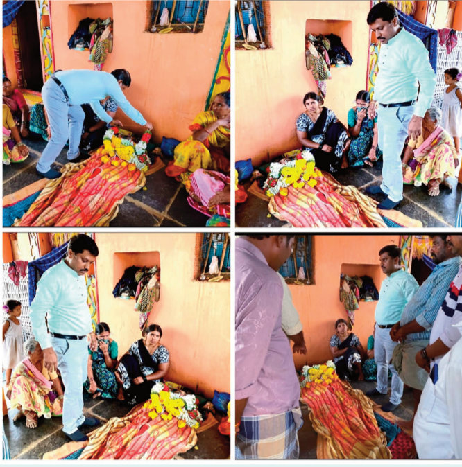
పాములపాడు, డిసెంబర్ 21 (కౌత్తస్వరం):