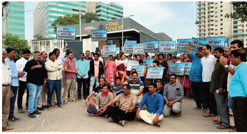
ఉప్పల్, డిసెంబర్ 21 (కౌత్స్వరం):