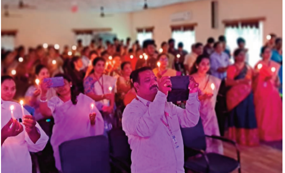
విన్నూ వలె నీ పాపగు వారిని ప్రేమించుము ప్రతి ఒక్కరికి శాంతి మార్గమే చక్కని జీవన మార్గం