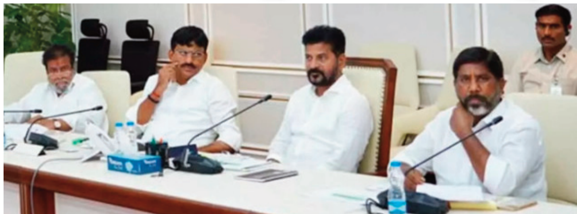
హైదరాబాద్, జూన్ 18 (కాత్మనందం):

రూ.2 కోట్ల వ్యయంతో ప్రత్యేక సాఫ్ట్వేర్ అభివృద్ధి ఉత్తరాఖండ్ మోడల్ ఆధారంగా తెలంగాణలో అమలు ట్యాబ్లు, కంప్యూటర్ల ద్వారా క్యాబినెట్ ఫైళ్ల పరిశీలన NICSి సహకారంతో డిజిటల్ వ్యవస్థ రూపకల్పన