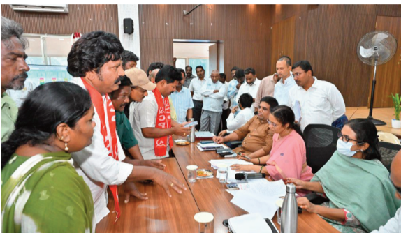
పాణ్యం నియోజకవర్గ నాల్గవ పర్వటనలో ఫిర్యాదుల స్వీకరణ

మున్సిపల్ కౌన్సిల్ హోల్ లో ప్రజలతో ముఖాముఖీ