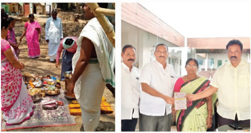
రాజకీయాలకు అతీతంగా వేంపెంటలో పాటు పనిర గ్రామాల ప్రజలు, పాములపాడు మండల వాసులు, భక్తులు కుటుంబ సమేతంగా విచ్చేసి శ్రీ సీతారామచంద్ర స్వామివారి దివ్య ఆశీస్సులు పొందాలని నిర్వాహకులు హృదయపూర్వకంగా ఆహ్వానించారు.