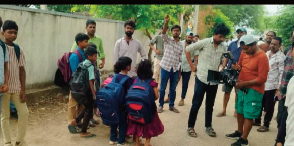
బషీరాబాద్, జూన్ 9 (కొత్తస్వరం):