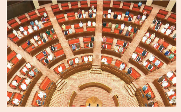
న్యూఢిల్లీ, జూన్ 1 (కొత్తపేట):

ఏపీ సహా పలు రాష్ట్రాల్లో 27 రాజ్యసభ స్థానాలకు ఎన్నికలు జూన్ 8 వరకు నామినేషన్ల స్వీకరణ జూన్ 18న పోలింగ్, అదే రోజు ఫలితాలు బీహార్, కర్ణాటకలో శాసనమండలి ఎన్నికలు కూడా ఎన్నికల నోటిఫికేషన్ జారీ చేసిన కేంద్ర ఎన్నికల సంఘం