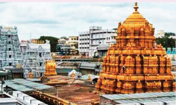
తిరుమల, జూన్ 01 (కాత్మస్వరం):

శ్రీవారికి రికార్డు స్థాయి ఆదాయం మే నెలలో 25 లక్షలకు పైగా భక్తులకు దర్శనం హుండీ ద్వారా రూ.120.28 కోట్ల ఆదాయం 12.29 లక్షల మంది భక్తుల తలనీలాల సమర్పణ వేసవి సెలవులతో భారీగా పెరిగిన రద్దీ భక్తులకు ప్రత్యేక సౌకర్యాలు కల్పించిన టీటీడీ