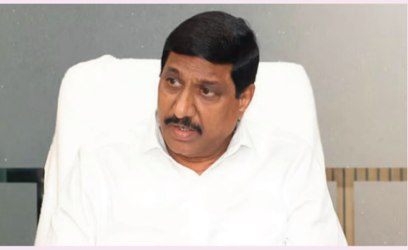
కర్నూలు, జూన్ 01 (కాత్మస్వరం):

వైఎస్సార్ విగ్రహాన్ని ధ్వంసం చేసింది వైసీపీ కార్యకర్తలని ఆరోపణ స్థానిక సంస్థల ఎన్నికల నేపథ్యంలో కుట్రలు జరుగుతున్నాయన్న మంత్రి కూటమి కార్యకర్తలు అప్రమత్తంగా ఉండాలని పిలుపు శాంతిభద్రతలకు భంగం కలిగించే ప్రయత్నాలు జరుగుతున్నాయన్న వ్యాఖ్య వైసీపీకి కూటమి ప్రభుత్వాన్ని విమర్శించే అర్హత లేదని విమర్శ